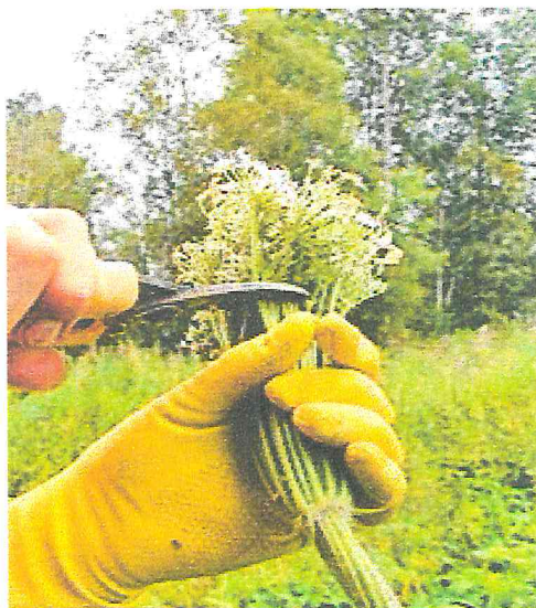
Рисунок 5 – Обрезка цветков борщевика

При более ранней срезке будет происходить сильное отрастание, а при более поздней велика вероятность дозревания семян в уже срезанных растениях, поэтому срезанные растения необходимо уничтожить сжиганием [4].