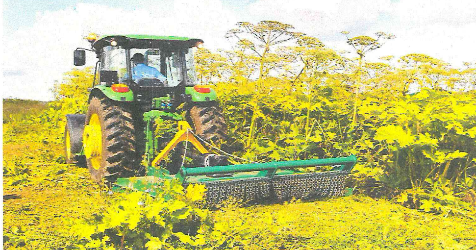
Рисунок 3 – Механизированное скашивание борщевика Сосновского

Как способ искоренения борщевика рассматривают также скашивание (рисунок 3). Однако, как показывает практика, многократное скашивание растений борщевика Сосновского, даже на протяжении нескольких лет, не оказывает значимого воздействия на численность популяции растения. После каждого скашивания на материнском растении из корневых почек отрастают новые молодые побеги. Скашивание эффективно только для предотвращения цветения и образования семян и может быть использовано для создания буферных зон, предотвращающих попадание новых семян на освобождаемую территорию.