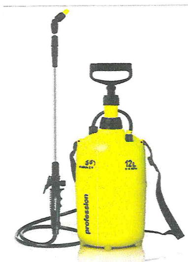
Рисунок 10 - Ручной ранцевый опрыскиватель

При небольших объёмах обработок используется ранцевый опрыскиватель с объёмом бака 12 литров (рисунок 10).