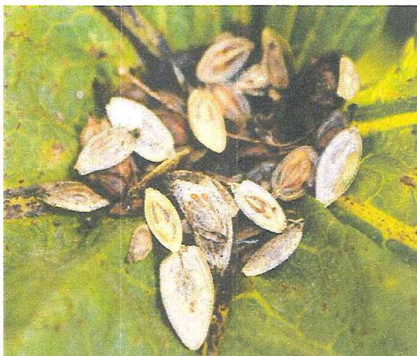
Рисунок 2 – Семена борщевика Сосновского

Почти все семена, появившиеся в конце лета, имеют недоразвитый эмбрион. Они вызревают при воздействии низких среднесуточных температур (2-4°C) в течение 1-2 месяцев, во влажной среде. Поэтому новые семена осенью не прорастают, им необходим период покоя. Основная масса семян располагается в верхних слоях почвы на глубине 5 см. Жизнеспособность семян сохраняется до 5 лет.