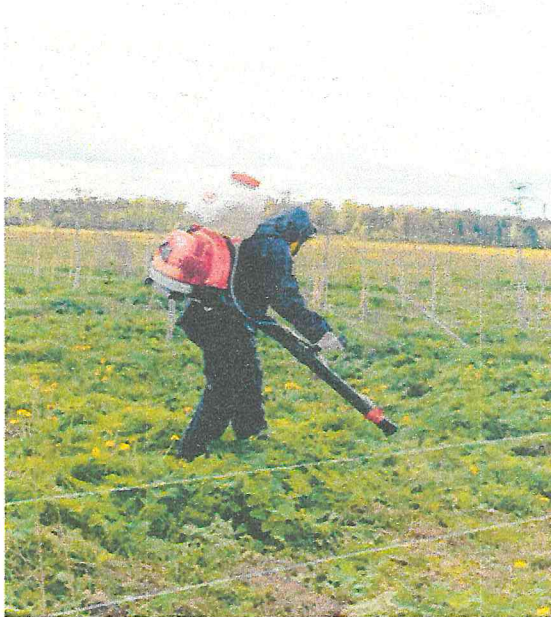
Рисунок 8 – Проведение обработок

6. Однократная обработка (рисунок 8) баковой смесью гербицидов Флоракс, КС (0,4 л/га) + Магнум, ВДГ (15 г/га) + Витанолл, Ж (50 мл/100 л рабочего раствора). Опрыскивание проводится в ранние фазы роста борщевика, при средней высоте 20-40 см.