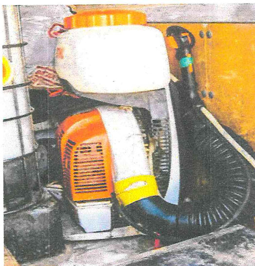
Рисунок 9 - Ранцевый моторный опрыскиватель

жидкости на мелкие капли в потоке воздуха большой скорости, создаваемом вентилятором) (рисунок 9). Ширина рабочего захвата при этом не должна превышать 5 м.