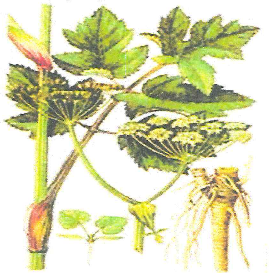
Рисунок 1 – Борщевик Сосновского

Корневая система борщевика Сосновского стержневая. Основная масса корней находится на глубине 30-50 см. Радиус распространения корневой системы может